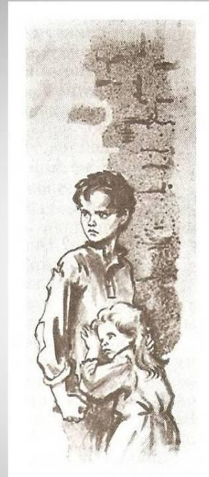
Валек и Маруся Худ. Г. Фитингоф